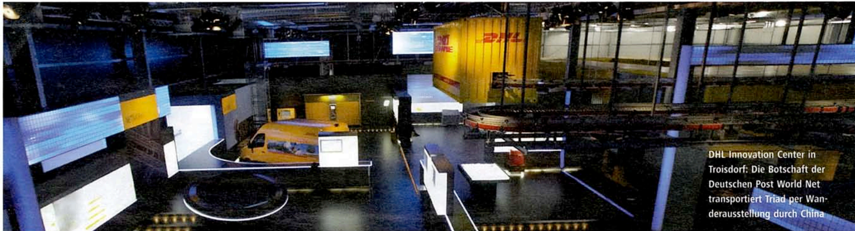
DHL Innovation Center in Troisdorf: Die Botschaft der Deutschen Post World Net transportiert Triad per Wanderausstellung durch China

Die Expo-erfahrenen Szenografen von Triad sind auch zur Weltausstellung 2010 in Shanghai gefragt