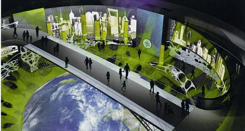
IM PAVILLON von „Urban Planet“: Das computergenerierte Bild zeigt eine Brücke, über die die Besucher geführt werden, um Glamour und Fragilität der Megacity zu erleben