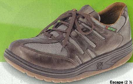
Escape (2 ½ - 8 ½)

Fachhändleradressen in Ihrer Nähe finden Sie unter: www.sanoshoes.com