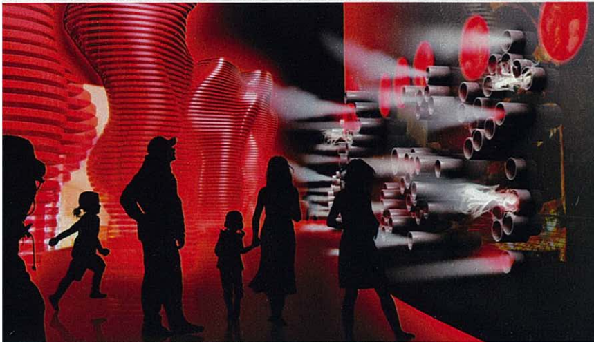
HORRORVISION der Verstädterung: In einem ganz in Rot ausgeleuchteten Raum werden die Besucher mit den Abgas- und Energieverbrauchproblemen konfrontiert

Triad-Projekte seien arbeitsteilige Gesamtkunstwerke mit Hilfe avanciertester Technik.