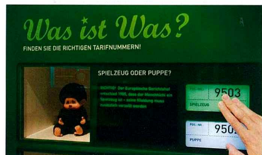
Inszenierung „Bundeszollverwaltung“, Detail der Interaktion zur Tarifeinreihung.

Exponate in Vitrinen sind ausgewählt, die Objekttexte geben in einem Kurzsatz Auskunft über wissenschaftliche Hintergründe. Grafiken an Vitrinenrückseiten oder -böden unterstützen die Geschichte der Exponate. Ein Podestband verbindet die einzelnen Kapitel in ihrer Chronologie und thematischen Abfolge und dient als Stellfläche für Großexponate. Hochwertig präsentierte, scheinbar unpassende Alltagsgegenstände geben Rätsel auf und eröffnen ungewöhnliche Einblicke in die zöllnerische Arbeit.