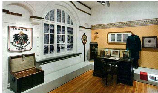
Inszenierung „Deutsches Kaiserreich“, Amtsstube eines Vorstehers eines Hauptzollamts, um 1900. Alltagsobjekt Kaffeedose im Podestband-Vitrine.

Das gestalterische Konzept folgt dem narrativen Ansatz der Dramaturgie. Jeder Themenkomplex wird mit einer zentralen Inszenierung eingeleitet – diese bildet den Mittelpunkt des jeweiligen Bereiches. Eine Szene mit originalen Objekten, einer Figurine in einer historischen Uniform und einer illustrierenden Hintergrundgrafik setzten die Atmosphäre. Die Szene ist nicht realistisch nachgebildet – die Hintergrundgrafik geht über die bloße Dekoration hinaus, die Figurinen sind abstrakt, d.h. keine Schaufensterpuppen oder Wachsfiguren. Die Gegenstände selbst sollen sprechen, das Bild im Hintergrund einen inhaltlichen Bogen spannen.