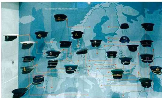
Inszenierung „ZöllnerInnen in Europa“.

Auch im Erdgeschoß steht jeweils eine zentrale Inszenierung im Mittelpunkt eines Kapitels. Die Fächerstruktur ist einerseits eine Referenz an die ehemalige Nutzung des Gebäudes als Zollamt, andererseits unterstützt sie die Konzentration auf den jeweiligen Inhalt und die jeweiligen Themen, die unterschiedliche Aspekte der heutigen Zolltätigkeit darstellen. Der Zoll präsentiert sich als sympathische, vielseitige und mitten im Leben stehende Organisation – das wird durch die Verwendung des Farbspektrums von hellen, freundlichen Blau-, Grün-, Gelb- und Orangetönen unterstützt. Eine Dauerausstellung der Gegenwart muß in ihrer Ausprägung den Wechsel von Moden, den Wandel von Wahrnehmungs- und Rezeptionsgewohnheiten im Blick haben, ohne diese voraussehen zu können. Deshalb wurden im Erdgeschoß beispielsweise Fotografien nur da eingesetzt, wo sie aktualisierbar sind.