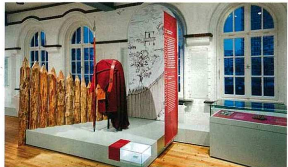
Inszenierung „Römische Provinzen“ mit Kleidung eines Benefiziaris.

Das Deutsche Zollmuseum Hamburg erzählt die Geschichte und Gegenwart des Zolls – und vereint damit unter seinem Dach auf 800 m 2 ein kulturhistorisches Museum und einen Ort staatsbürgerlicher Bildung. Es befindet sich in einem denkmalgeschützten Gebäude am Eingang der Speicherstadt in Hamburg. Noch bis 1985 wurde es als Zollamt Kornhausbrücke für den Freihafen genutzt, zuletzt für die Abfertigung von Teppichen. Mit der Entwicklung der Hafencity zu einem neuen Zentrum Hamburgs bot sich das Gebäude zur Nutzung als Zollmuseum an. 1992 wurde das Deutsche Zollmuseum eröffnet, nach 15 Jahren mit jährlich über 100 000 Besuchern wurde es komplett umgestaltet. Triad Berlin war mit der Konzeption, Gestaltung, Planung und Realisierung betraut, in enger Abstimmung mit den MitarbeiterInnen des Deutschen Zollmuseums, der Zollverwaltung in Bund und Ländern, dem Bundesfinanzministeriums sowie mit thematisch-inhaltlicher Unterstützung von wissenschaftlichen ExpertInnen.