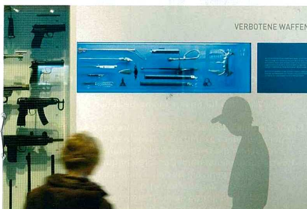
Inszenierung „Waffen und Rauschgift“, Detail.

Die Exponate sind das Bindeglied zwischen dem inhaltlichen und dem szenographischen Konzept. Etwa 450 Objekte sind nach der Umgestaltung ausgestellt – ein Bruchteil der Sammlung. Sie sind ein Beleg und der Ausgangspunkt für die Geschichte. Geschichte anhand von Geschichten erzählen – die Geschichten hinter den Exponaten aufzuspüren und zu vermitteln, ist ein zentrales Anliegen. Für dieses Geschichtserzählen brauchen Exponate Raum, eine Bühne. Die Bühne gestaltet die Szenographie.