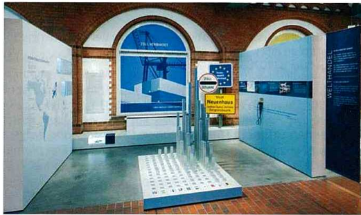
Inszenierung „Welthandel“ mit dreidimensionaler Exportstatistik und integrierter Medienstation.

Im Erdgeschoß, in der Gegenwart, sind die Themen nicht chronologisch geordnet, schließlich handelt es sich um die Inszenierung des Heute. Scheinbar ein Paradox: Eine Dauer-ausstellung, angelegt für die nächsten 10 bis 15 Jahre, spricht über das jeweilige Heute. Deshalb war es ein wichtiger inhaltlicher und szenographischer Ansatz, zukünftig Änderungen oder Ergänzungen vornehmen zu können. Zum Beispiel ist die dreidimensionale Statistik im Themenbereich Welthandel so angelegt, daß sie in den nächsten Jahren aktualisierbar ist.