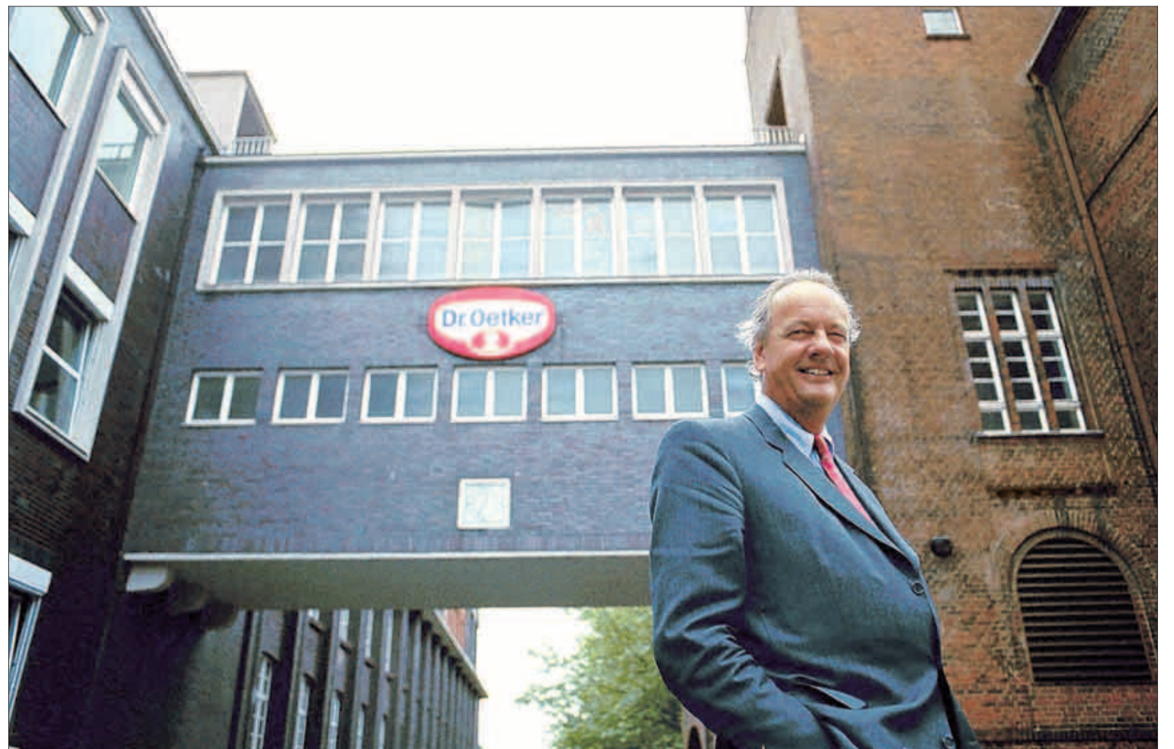
Einen Marken-Erlebnispark hat sich Oetker-Konzernchef August Oetker auf das Bielefelder Firmengelände gestellt

Was für Volkswagen die Autostadt ist, soll die „Dr. Oetker Welt“ für den Bielefelder Nahrungsmittelkonzern werden: Ein Erlebnispark , der die Marke stärkt, „gegen die Ausdehnung des Discount“, sagt Oetker-Chef August Oetker