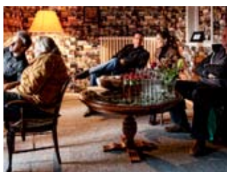
Riesenerfolg für 24h Berlin

Dazwischen liegen mehr als 150 Projekte und mehr als 500 Menschen, die unsere Arbeit kreativ mitentwickelt haben. Die neue Gründerzeit und der Medienhype der 90er Jahre sind Geschichte. Bewahrt haben wir uns die Neugierde und die Bereitschaft, Unmögliches möglich zu machen, Dinge neu zu erfinden und mutig zu sein. Das heißt zum Beispiel nach China zu gehen, dort die Füße auf den Boden zu bekommen und dabei den Blick jenseits des Horizonts nicht zu verlieren. Der Beginn von Triad lag zwar im letzten Jahrtausend aber wir haben noch lange nicht genug davon: mehr Phantasie zu wagen!