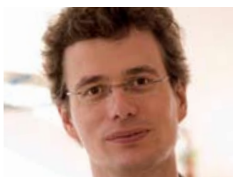
Triad Berlin eröffnet Repräsentanz in Köln