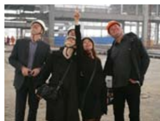
„Urban Planet“ Pavillon auf der Expo Shanghai 2010