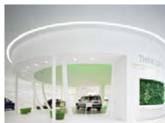
Triad in Touch with Škoda