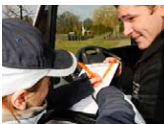
Ein Crafter für alle Fälle