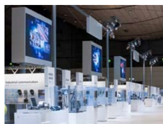
Mit Triad auf der Hannover Messe