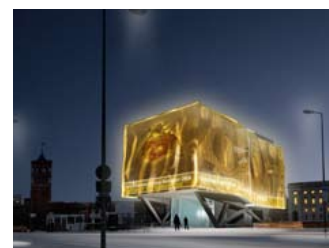
Humboldt-Box auf dem Berliner Schlossplatz