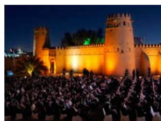
Abu Dhabi Classics