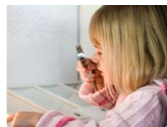
Das LaserLab zu Besuch im Dynamikum