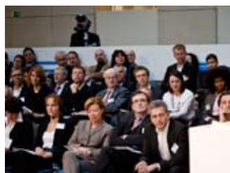
Denk ich an Deutschland