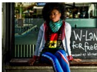
Farbwerte – Ausstellungstipp