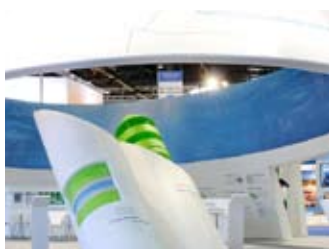
Triad in Argentinien